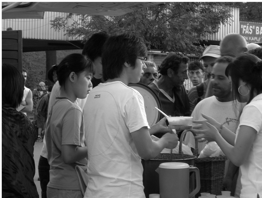
1. kép. A Moszkva téren kínai önkéntesek ingyenebédet osztanak a rászorulóknak

Chinese volunteers serve free hot meals for poors in Moscow Square, Budapest