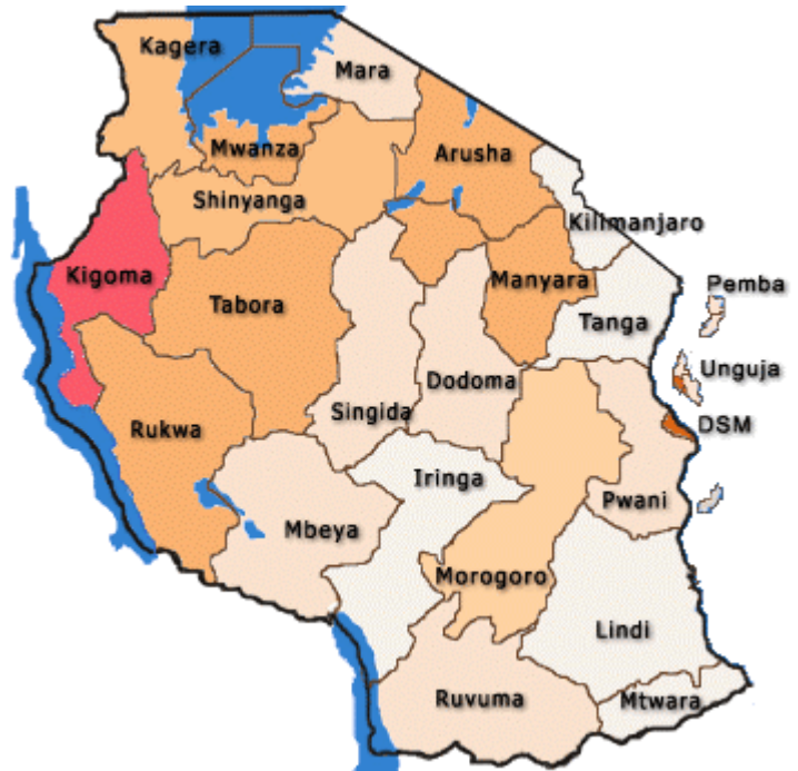
1. ábra Tanzánia és szomszédjai