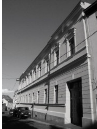
3. ábra – A Matessa Árvaház