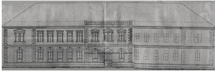
2. ábra – A megyei árvaház

költsége 54 000 forintba került. 100 árva gyereknek biztosított jó életkörülményeket két tágas hálóterem, két tanulószoba, egy ebédlő és egy díszterem. Külön szobában laktak az irgalmas nővérek. Az árvaházat nagy udvar vette körül. 12 A dombtetőn elhelyezett nagyméretű középület uralkodott az akkor még kevésbé beépített Mecsek oldalon. 13