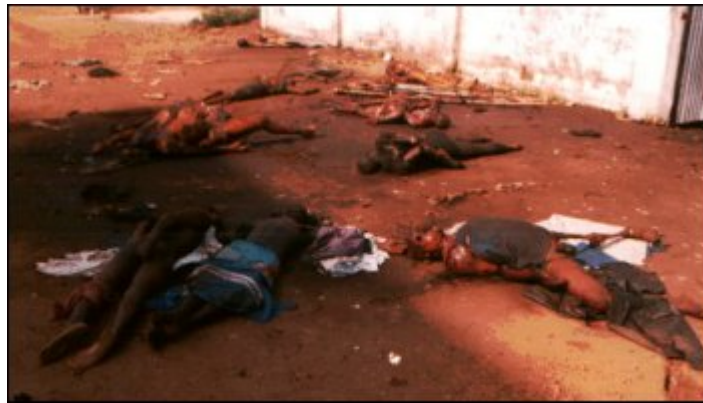
1. ábra A RUF mészárlása

A Foday Sankoh 4 által irányított Forradalmi Egység Front (RUF) 5 lázadói 1991-ben kirobbantották a polgárháborút. A gerillatámadások kivitelezéséhez a kilátástalan szociális helyzetben lévő fiatalokban találta meg a partnereit. A szegényebb régiókban élő kamaszok kilátástalan, nagyon rossz szociális körülmények között élnek, s a RUF-hoz való csatlakozás hízelgő karrierlehetőség volt és az még a mai napig is a számukra. A lázadók között a szegény fiatalok húst ehetnek, saját fegyverük lehet, és végeredményben szabadon garázdálkodhatnak.