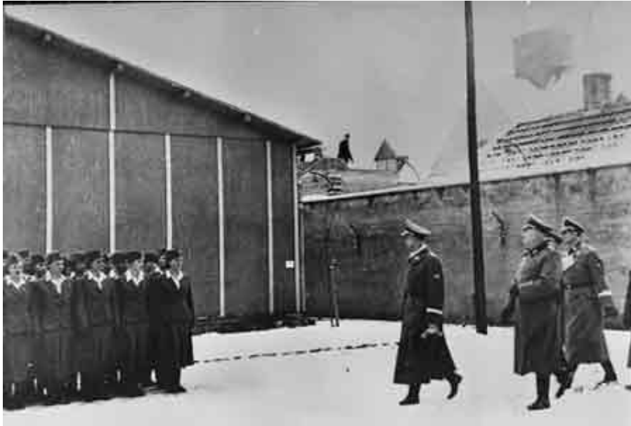
Heinrich Himmler 2 látogatása Ravensbrückben