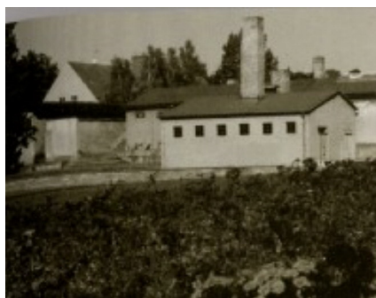
A ravensbrücki gázkamra és krematórium

A szelekció Ravensbrückben is a többi táborhoz hasonló elv szerint működött: aki nem munkaképes, azt el kell pusztítani. 12 Természetszerűleg az idősek, a betegek, a nagyon legyengültek, illetőleg a túl fiatalok kerültek a „Jugendlagerba”. Rajtuk kívül pedig még azok, akikre a legszigorúbb büntetést akarták kiszabni a tábor vezetői.