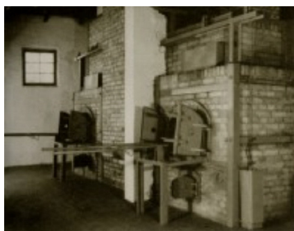
A hullaégető kemencék

Odette Sansom, az egyik angol fogoly, Hamburgban, a háborús bűnösök felett ítélező törvényszék előtt tett tanúvallomásában, kijelentette, hogy látta, amint a nácik élve a krematóriumba tereltek női foglyokat, akik szörnyű jajveszékelések közepette, eleven elégték. 14