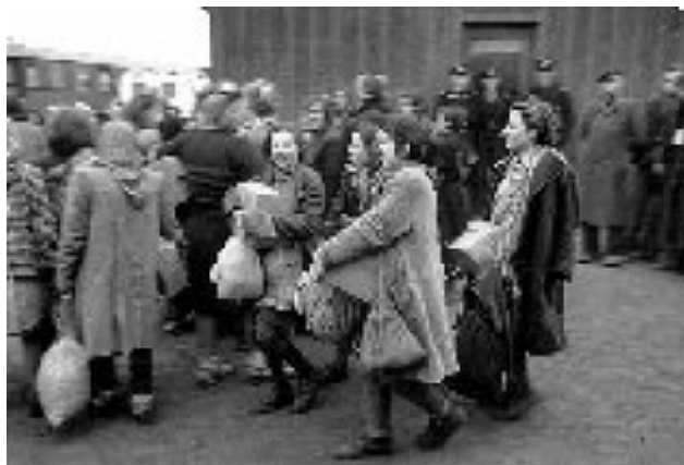
A Felszabadulás pillanatai Ravensbrückben 1945. április 29.