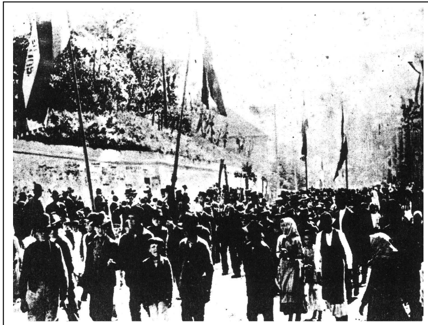
3. számú fénykép