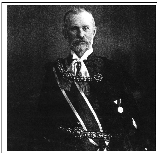
2. számú fénykép

Tolna megyében a Perczel név elegendő volt a szavazatok többségének megszerzéséhez, függetlenül attól, hogy milyen párt színeiben indultak. 46 A bonyhádi kerületben Dőry Dénes 47 , a közkedvelt alispán 1887-ben más elfoglaltságokra hivatkozva nem indult, ettől kezdve Perczel Dezső 48 sorra nyerte a választásokat. A bonyhádi volt a megye egyetlen kerülete, ahol 1906-ig kizárólag szabadelvű jelölt győzött a választásokon, egyrészt a német nemzetiségű választópolgárok elsöprő fölényének, részben a képviselőjelöltek országos ismertségének köszönhetően.